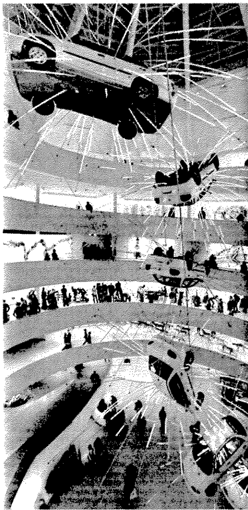
La espectacular obra de Cai Guo Qiang, en el Guggenheim neoyorquino.

EN LO QUE VA DE AÑO HAN AUMENTANDO LOS VISITANTES LOCALES Y ESTATALES, QUE SE SITUAN EN UN 38% DEL TOTAL