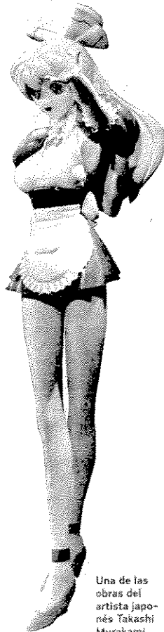
Una de las obras del artista japonés Takashi Murakami

Este era precisamente uno de los objetivos que los responsables del museo se habían marcado desde el año pasado, intentar captar más visitantes locales. Además, en el encuentro se abordó el inicio del proceso de elaboración del próximo Plan Estratégico 2009-2012, que estará finalizado en diciembre y en cuya definición participa la empresa Lord Cultura. M. REDONDO